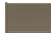
PLEINE p. 46