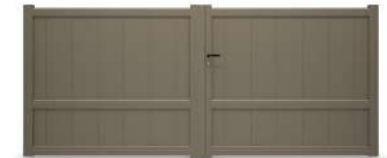
LA VILLETTE LAME 250 VERTICALE