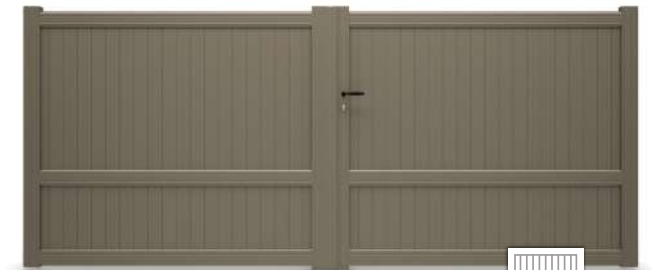
LA VILLETTE LAME 80 VERTICALE