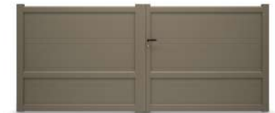
LA VILLETTE LAME 80 HORIZONTALE