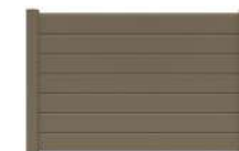
PARE-VUE p. 48