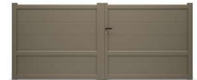
LA VILLETTE LAME 250 HORIZONTALE

LES MODÈLES PLEINS AVEC TRAVERSE INTERMÉDIAIRE, VOUS SONT PRÉSENTÉS À LA COULEUR 7006 SABLÉ. RETROUVEZ TOUTES NOS TEINTES PAGE 3.