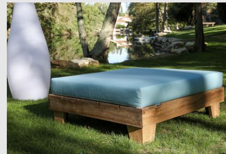
Pouf avec coussin

« Modulaire et pouvant servir aussi bien de pouf, de table basse ou pour agrandir votre canapé Mubally, notre table basse/pouf vous offre une panoplie de configurations uniques afin d'embellir votre extérieur selon vos désirs »